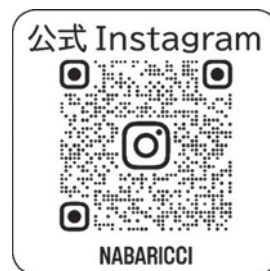
【↑フォローはこちら】