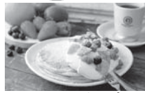
一番人気のスイーツ オカブラン