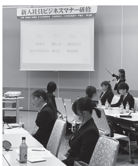
(昨年の研修の様子)

名張商工会議所では、今年も新入社員ビジネスマナー研修を企画しております。この研修は、ビジネスマナーの習得により一人前の社会人を育成する講座です。基本となる心構えから接客・応対・マナーまで幅広く学べ、毎年受講者の方々から好評をいただいております。市内の新入社員同士が業種に関わらず交流できる貴重な機会にもなりますので、ぜひご参加ください。