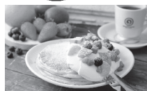
一番人気のスイーツ オカブラン