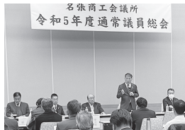
名張商工会議所 令和5年度通常議員総会 振興センターアスピアで、令和5年度第2回通常議員総会を開催しました。

「名張の経済は、人口減少による需要の縮小をはじめ、資源・原材料価格の高騰など、厳しい状態が続いている。感染抑制と経済活動の両立が進む中で株価は上昇し、様々な経済指標では個人消費などを中心に経済は持ち直している」とされているが、その実感がないというのが正直なところ。また、今年の春闘では大企業で満額回答が相次ぐなど、5%を超える大幅な賃上げとなっているが、巨額の内部留保がなく業績の改善が進まない中小・小規模事業者は昨年にも増して賃上げ原資の確保が課題と