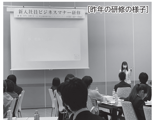
【昨年の研修の様子】

名張商工会議所では、今年も新入社員ビジネスマナー研修を企画しております。この研修は、ビジネスマナー習得により一人前の社会人を育成する講座です。基本となる心構えから接客・応対・マナーまで幅広く、分かり易く研修いたします。詳しくは3月号の会報にてご案内を送付しますので、ご検討をよろしくお願い致します。