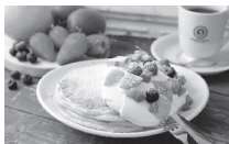
一番人気のスイーツ オカブラン