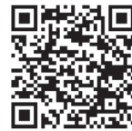
電子帳簿保存法特設サイト

電子帳簿保存法の中で、特に「電子取引データ保存」については、全ての事業所の皆さんにご対応いただく必要がある制度です。国税庁の『電子帳簿保存法特設サイト』などをご覧ください、内容のご確認をお願いします。