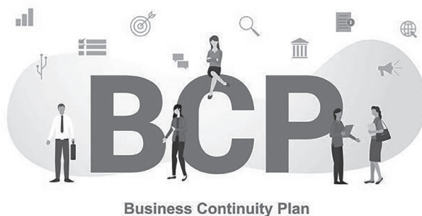
Business Continuity Plan

独立行政法人中小企業基盤整備機構 : https://kyoujinnka.smrj.go.jp/