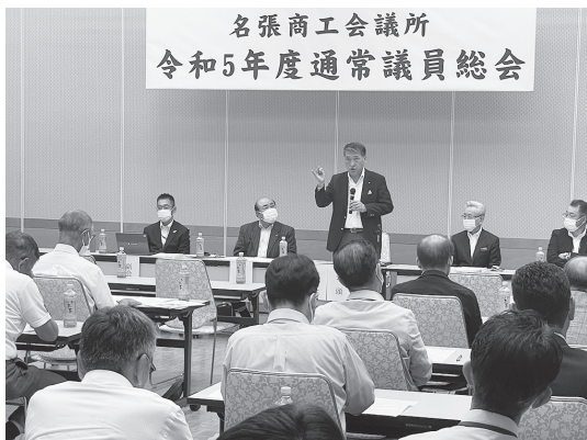
名張商工会議所 令和5年度通常議員総会

去る6月27日（火）12時より、名張産業振興センターアスパホールにおいて、令和5年度第1回通常議員総会を開催しました。冒頭、亀井会頭は「名張市の人口（令和5年6月1日現在）は、昨年同月比で850人減少している。そ