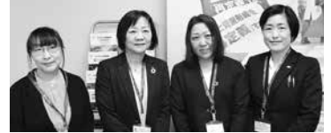
アクサ生命保険(株)推進員一同 「私たちにご相談ください」

*ご加入にあたっては、パンフレット、重要事項説明書(契約概要・注意喚起情報)を必ずご覧ください。