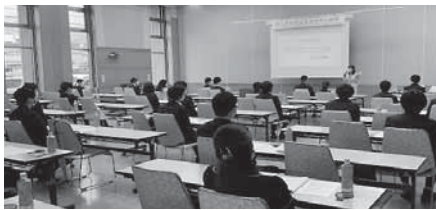
▲昨年の研修の様子

名張商工会議所では、今年も新入社員ビジネスマナー研修を企画しております。この研修は、ビジネスマナー習得により