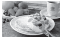
一番人気のスイーツ オカブラン

港屋珈琲 名張店 名張市夏見 302-3 リードタウン名張内 TEL 41-1611 (営業時間 7:00~23:00)