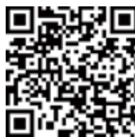
名張商工会議所 女性会 HP