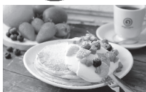
一番人気のスイーツ オカブラン