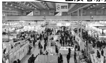
【昨年の会場の様子】 全国各地から様々な食品が出展

『こだわり食品フェア』は、会期中に約9万人の食品業界関係者が来場する「食」の専門展です。食品スーパー、百貨店等のバイヤーに対し、地域の食材等にこだわった地域食品の情報発信や商談を行うことが出来ます。名張商工会議所では会員事業所の販路開拓支援のため、昨年度に引き続き共同出展ブースを設けさせていただきましたので、出展者を募集いたします!!