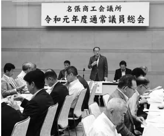
名張商工会議所 令和元年度通常議員総会

去る6月27日（木）12時より、名張産業振興センターアスパイアにおいて、令和元年度第1回通常議員総会を