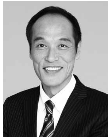
記念講演会講師 東国原英夫氏