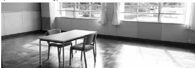
204号室 (オフィススペース) 56㎡

名張市滝之原1050番地 ☎0595-41-0365 (担当: 富永) http://nabariss.jp/office/sindex.html