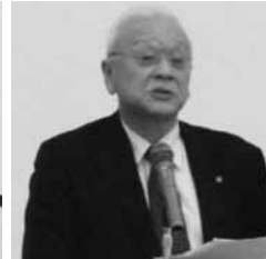
▲説明をする岩佐会頭（亀山）