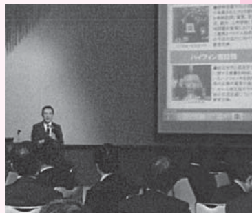
▲鈴木三重県知事の講話