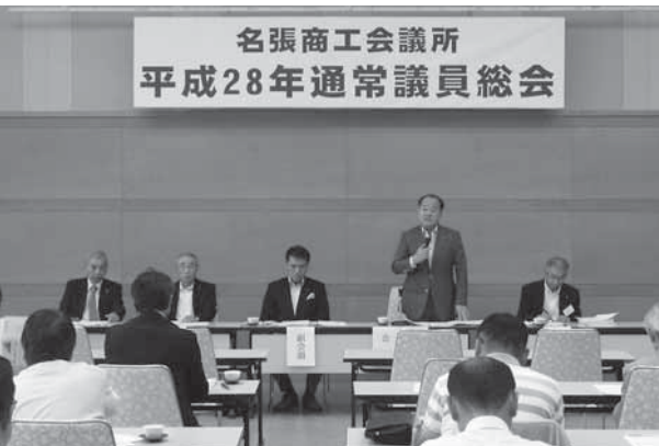
名張商工会議所 平成28年通常議員総会

三重県においては5月に「伊勢志摩サミット」が開催され成功裏に終えることが出来た。その中で、名張からは四蔵元の日本酒が食中酒などに採用された。日本酒を地場産業として世界へ発信して欲しい。また、当所はワイン醸造を検討しておりますので皆様のお知恵をお借りして進めて行きたい。