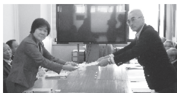
要望書を提出の様子