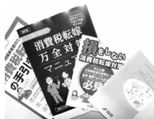
消費税転嫁対策関連パンフレット

つきましては、消費税転嫁対策並びにマイナンバー制度パンフレットは、名張商工会議所にて無料配付いたしますので、お越し下さいますか、お気軽にご連絡下さい。