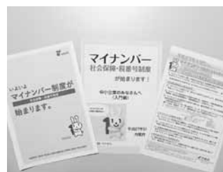
マイナンバー制度関連パンフレット並びにマイナンバー導入に係る従業員の少ない事業者向けチェックリスト