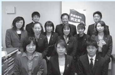
アクサ生命保険(株)推進員一同 「私達にご相談ください!!」

病気・災害による死亡から事故による入通院まで、業務上・業務外を問わず24時間補償されます