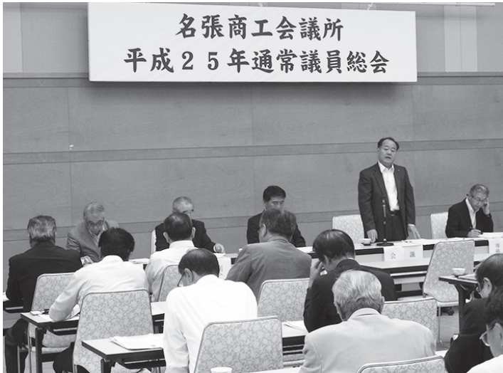
名張商工会議所 平成 25 年通常議員総会