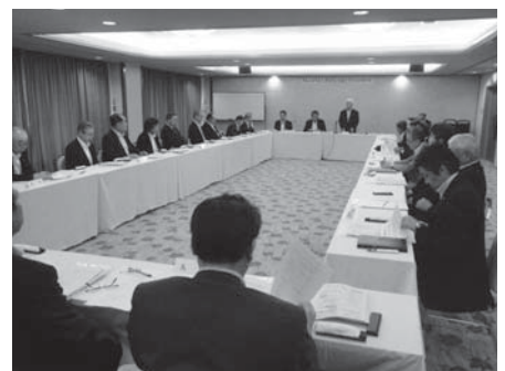
▲会議の様子 （県内各商工会議所会頭と専務理事）