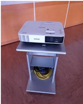
(プロジェクター ※EPSON EB-2065)