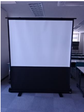
(80 インチ フロアタイプスクリーン)